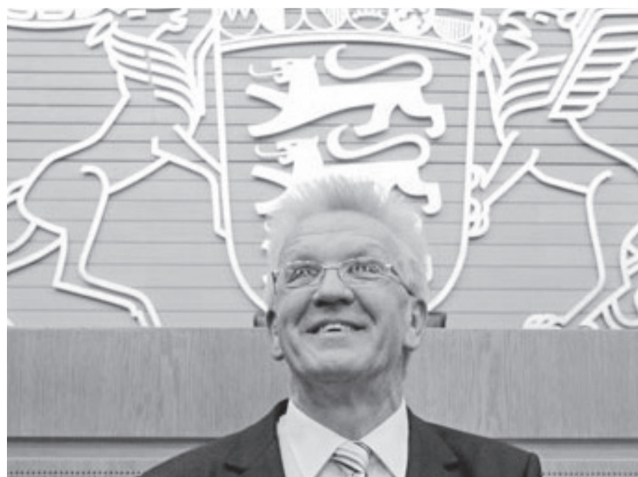
Winfried Kretschmann li mistenni jkun l-ewwel Prim Ministru tal-Hodor fi stat Germaniz